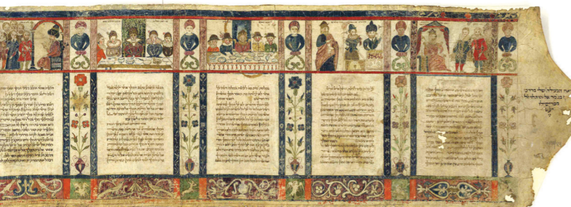
Свиток Эстер из Италии, 1616 год

Стоит отметить, что Фетмильх был настоящим Аманом того времени. Он яростно ненавидел евреев.